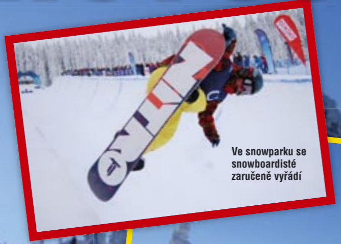
Ve snowparku se snowboardisté zaručeně vyřádí