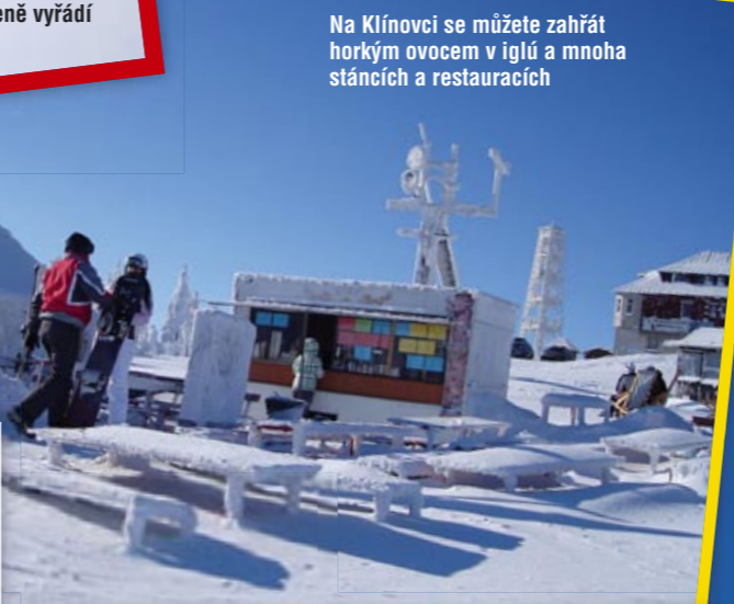
Na Klínovci se můžete zahřát horkým ovocem v iglú a mnoha stáncích a restauracích

Vyberte si ze dvou okruhů, menší měří 5 600 m, delší 12 900 m, a hledejte úkoly. Na začátku obdržíte Ježíškův zápisníček, kam si budete zapisovat správné odpovědi. Cesta má třináct zastávek, přičemž každá se věnuje jedné postavice z Ježíškova světa. K zastávkám se dostanete jednoduše – navedou vás ukazatele a poznáte je podle pěkných domečků, u nichž čeká vždy nějaká atrakce a úkol. Za jejich splnění nakonec děti dostanou drobné dárky.