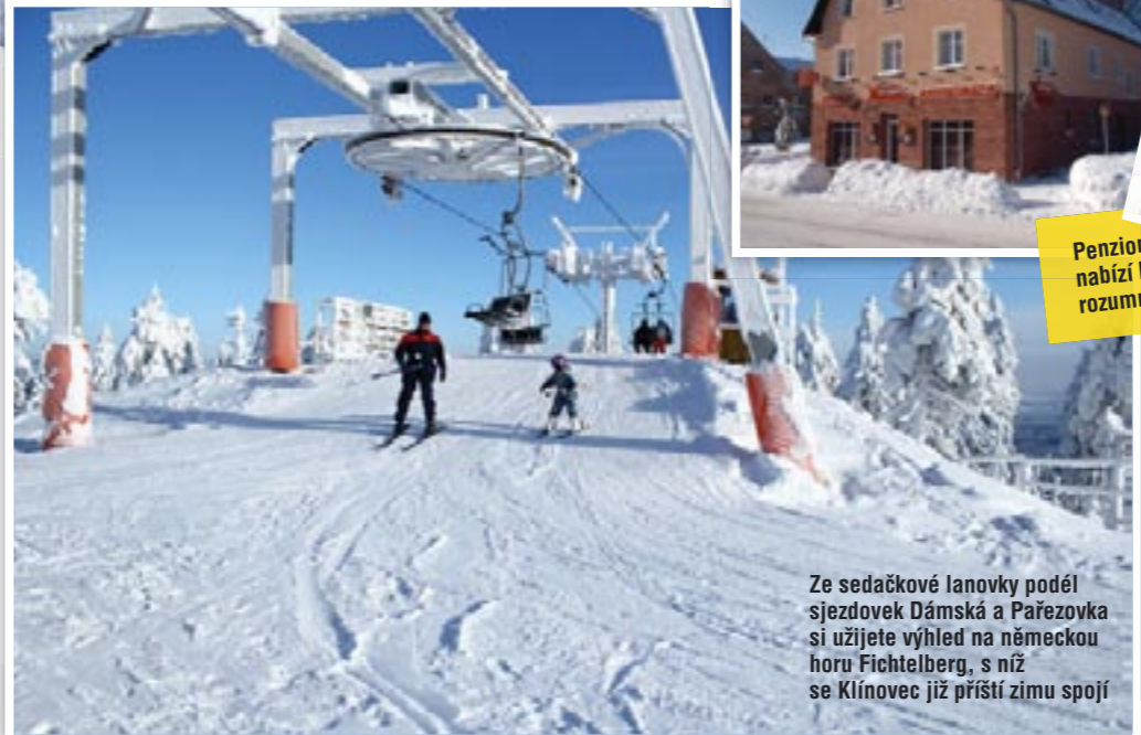
Ze sedačkové lanovky podél sjezdovky Dámská a Pařezovka si užijete výhled na německou horu Fichtelberg, s níž se Klínovec již příští zimu spojí