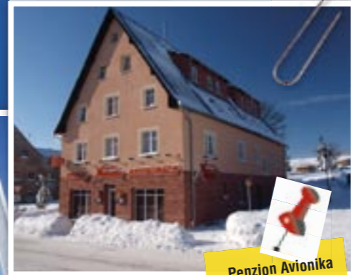
Penzion Avionika nabízí komfort za rozumné ceny

Ubytovat se můžete v penzionu Avionika zhruba 6 km od Klínovce ve vesničce Kovářská. Penzion je velice moderně vybavený a v jeho přízemí najdete vyhlášenou restauraci, kde určitě ochutnejte vepřovou panenku na fazolkách a mnoho dalších specialit. Po lyžování vám přijde vhod zdejší relax centrum s masážemi, saunou, masážní vanou a sprchou. Za dvoulůžkový pokoj se snídaní formou bufetu zde zaplatíte od 780 do 980 Kč. Více na www.penzionavionika.cz